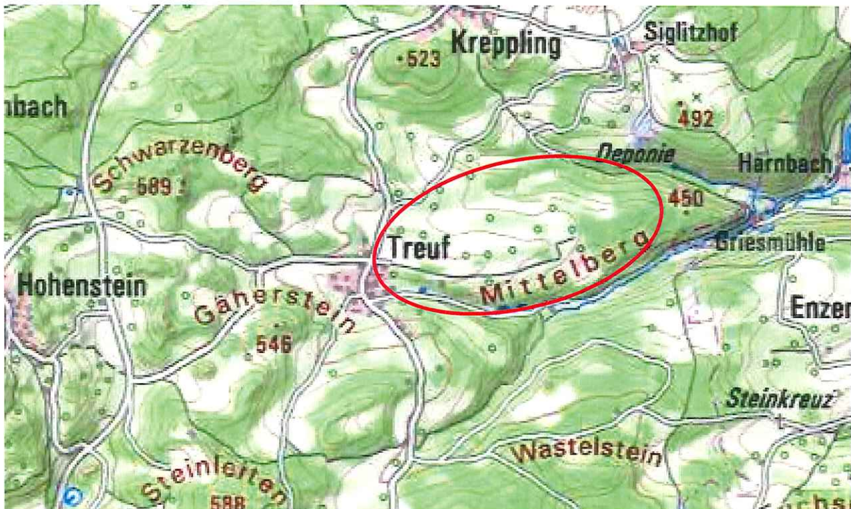
Kartenausschnitt mit Plangebiet

Die Aufstellungsbeschlüsse werden hiermit ortsüblich bekannt gemacht.