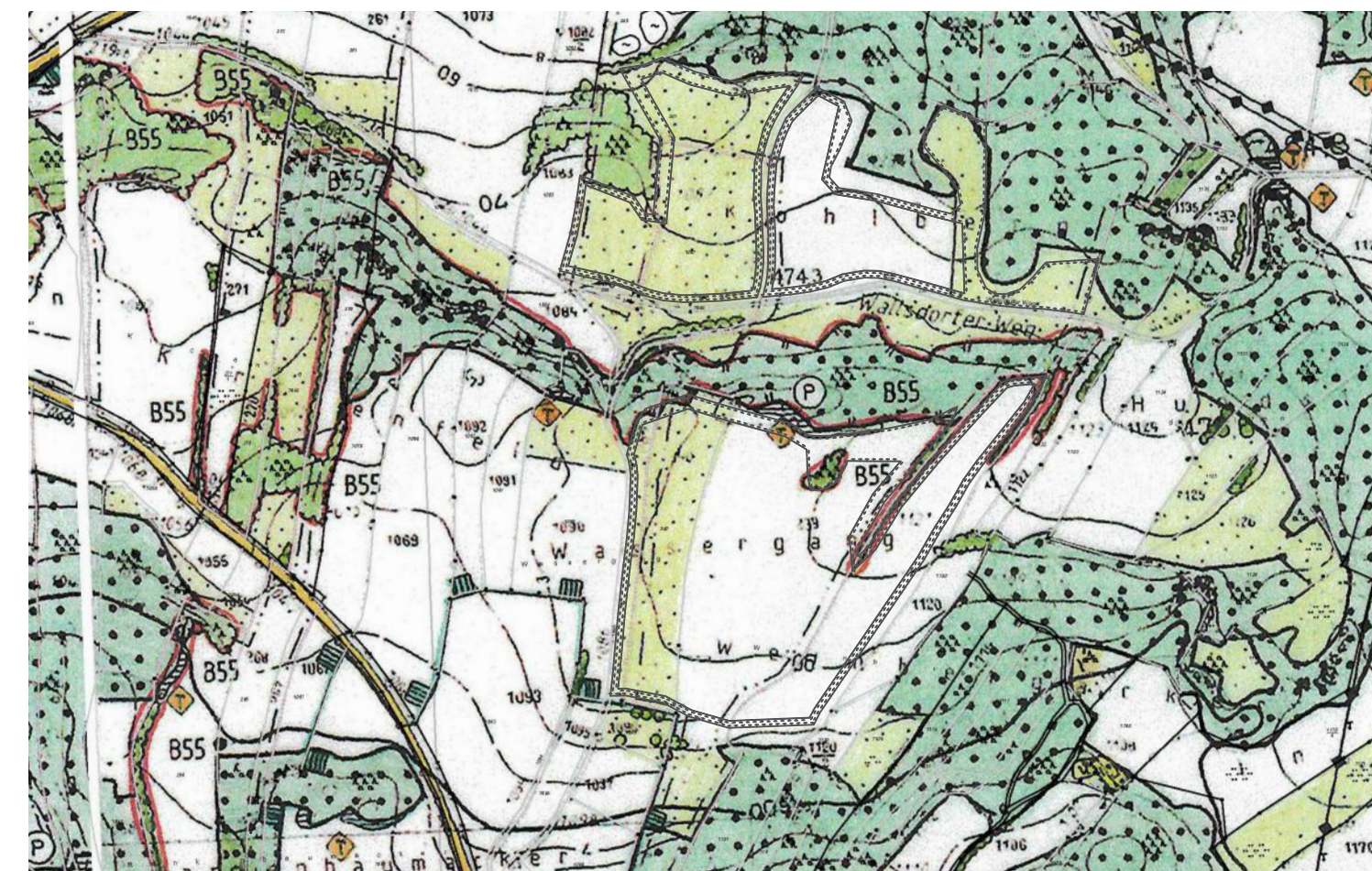
Rechtsgültiger Flächennutzungsplan vor der Änderung