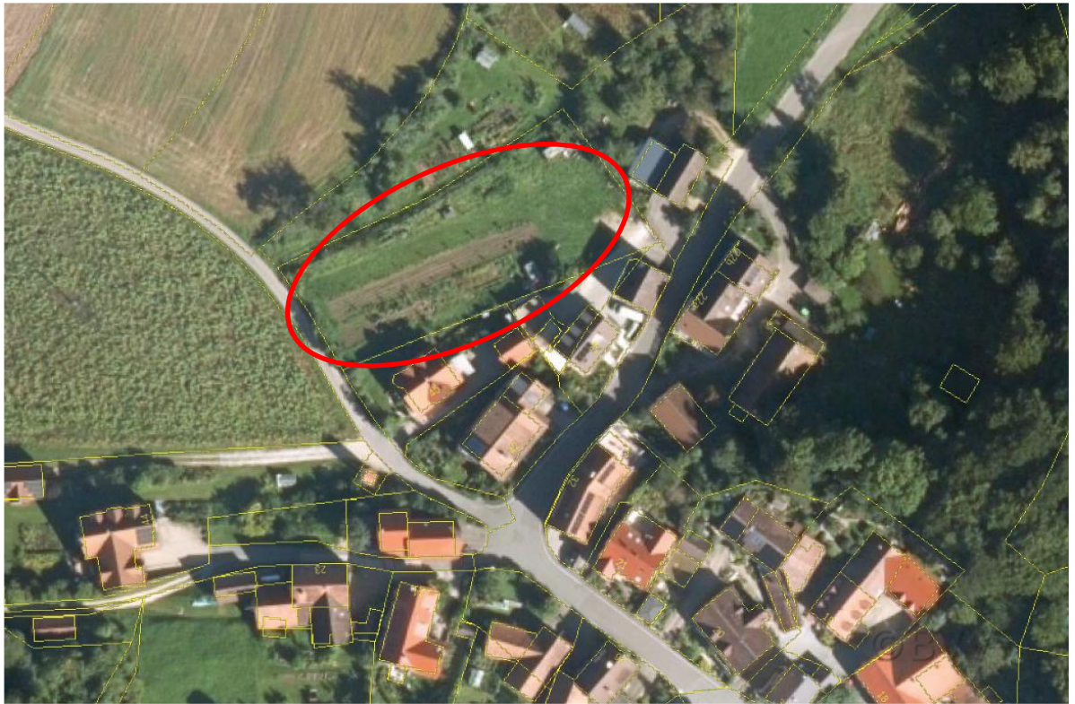
Luftbildkarte des Geltungsbereichs