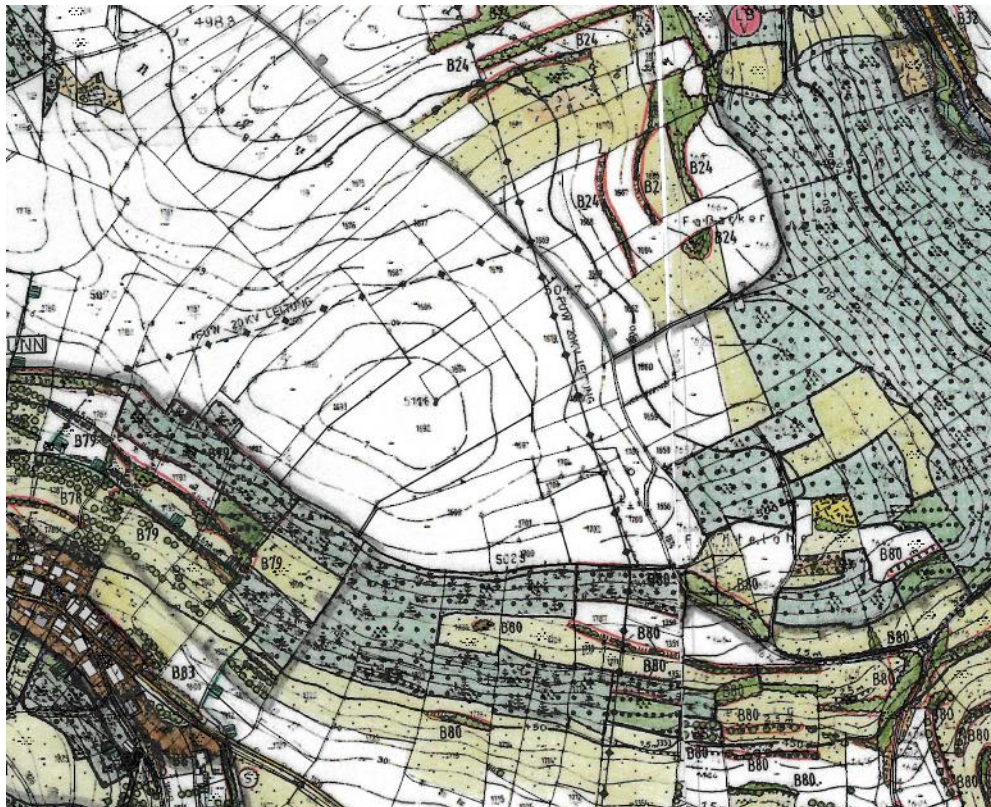
Abb. Geltungsbereich Planvorhaben im wirksamen FNP (maßstabslos)

Da die im Bebauungsplan getroffenen Festsetzungen und Gebietseinstufungen mit den Darstellungen des wirksamen Flächennutzungsplanes nicht übereinstimmen, wird dieser im Parallelverfahren gem. § 8 Abs. 3 Nr. 1 BauGB geändert. Entsprechend den geplanten Festsetzungen des Bebauungsplanes wird darin ein Sondergebiet Zweckbestimmung „Photovoltaik“ mit randlichen Ausgleichsflächen dargestellt.